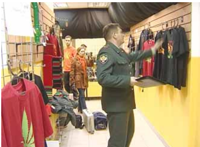
Очередной объект внимания новгородских наркополицейских — «хитрый магазинчик», где торговали наркотическими атрибутами

готовления дезоморфина. Нам следует обязательно поддержать их, — отметил руководитель региональной службы госнаркоконтроля.